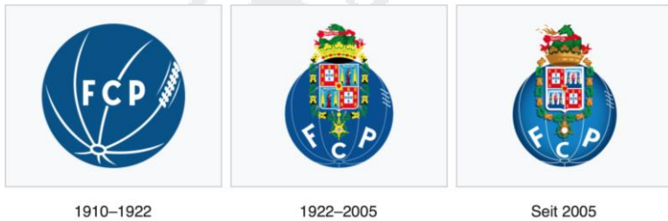
Die Logos des FC Porto seit 1910

Der Futebol Clube do Porto, kurz FC Porto oder Porto spielt in der ersten portugiesischen Fussballliga. Er wurde am 28. September 1893 gegründet. Neben Fussball betreibt der Verein die weiteren Sportabteilungen Leichtathletik, Basketball, Billard, Boxen, Camping, Schach, Angeln, Handball, Karate, Motorsport, Rollhockey, Behindertensport, Schwimmen und Gewichtheben.